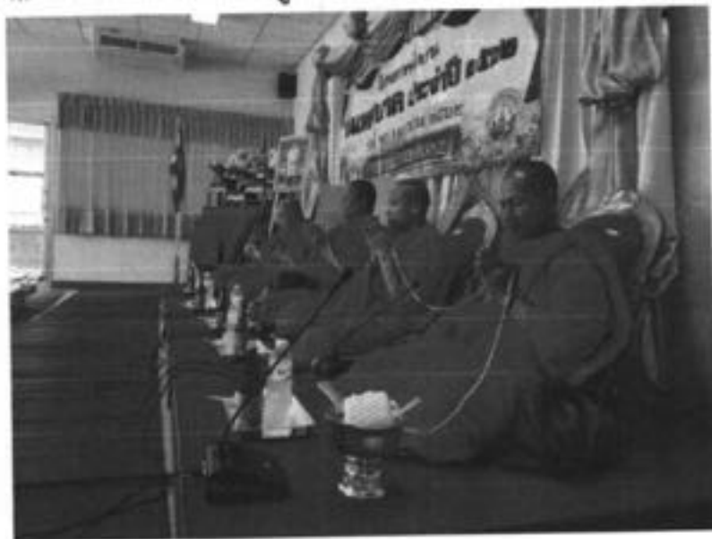
09.29 น. พระสงฆ์ จำนวน 5 รูป ประกอบพิธีทางศาสนา เจวัญพระพุทธรณ์